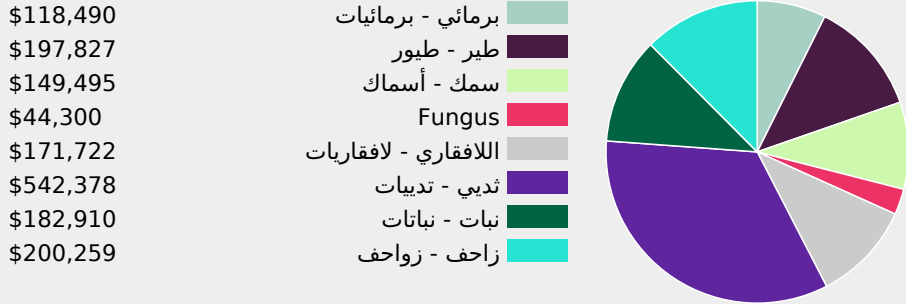
توزيع المبالغ حسب القائمة الحمراء للإتحاد الدولي لحفظ الطبيعة