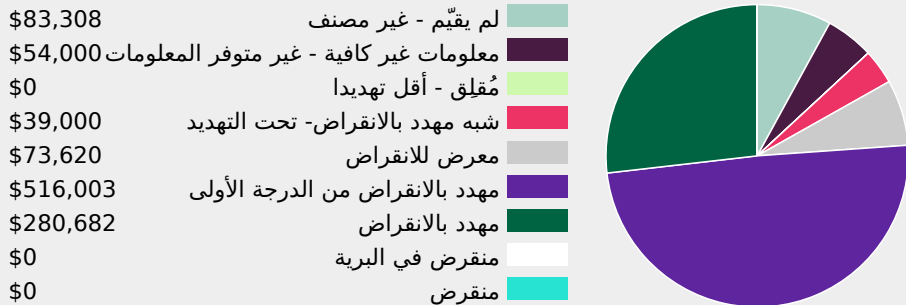
توزيع المبالغ حسب القائمة الحمراء للإتحاد الدولي لحفظ الطبيعة