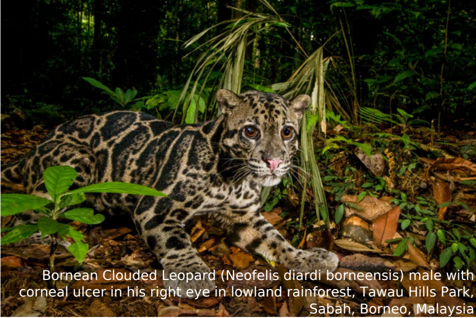
Bornean Clouded Leopard ( Neofelis diardi borneensis ) male with corneal ulcer in his right eye in lowland rainforest, Tawau Hills Park, Sabah, Borneo, Malaysia