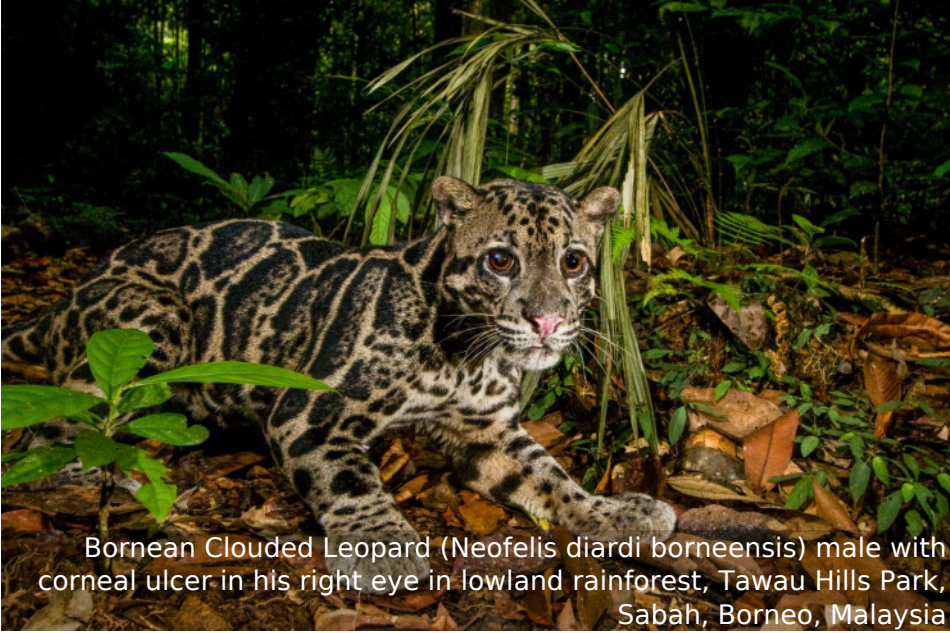
Bornean Clouded Leopard ( Neofelis diardi borneensis ) male with corneal ulcer in his right eye in lowland rainforest, Tawau Hills Park, Sabah, Borneo, Malaysia